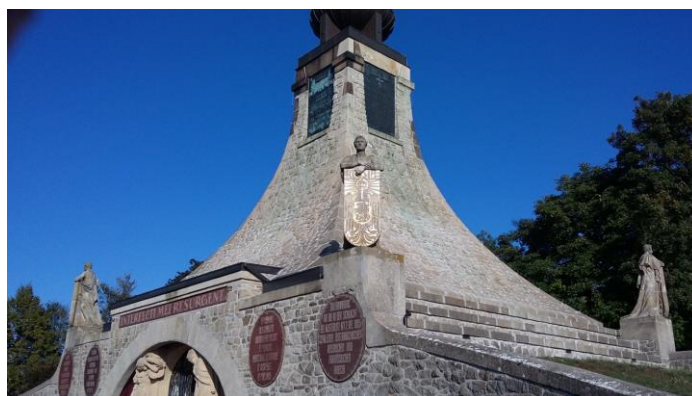
Az emlékmű és a négy nyelvű feliratok

Utunk következő állomása a buchlovi vár volt. Az ódon várfalak, a kivételesen mély várárok, a szép ívű és épen maradt bástyák a középkor levegőjét árasztják. A sziklafalakból növények, sőt fák nőttek ki. A hangulatos várudvar azonban az utószezon levegőjét árasztotta, már nem fogadtak látogatókat, a várban lévő kiállítás sem volt megtekinthető. A borongós időben aztán visszazárltunk az autóbuszba, és elindultunk a Brünn közelében fekvő Austerlitzba (Slavkov u Brna). Pár kilométerre a várostól zajlott az ún. három császár csatája 1805. december 2-án, amikor is Napóleon vereséget mért az egyesített osztrák-morva-orosz seregekre. Křenovice, majd Prace községeken áthaladva busszal felmentünk az austerlitz csatatér fölött magasodó óriási emlékműhöz.