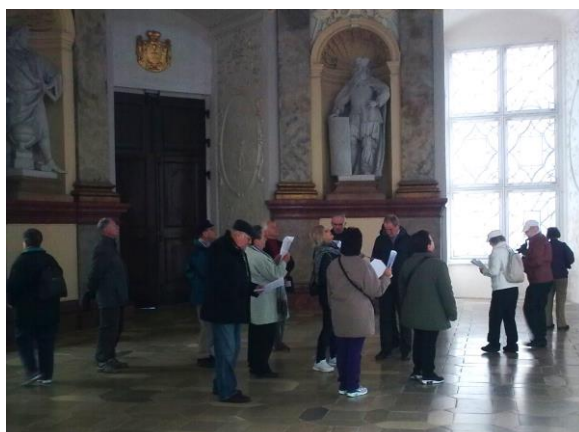
Csoportunk a vranovi várkastélyban

Három napos kirándulást tettünk Dél-Morvaországban, összesen 18-an, 2016. október 7. és 9. között. Mielőtt belekezdenék a beszámoló részletezésébe, szükségesnek látok néhány, talán kevésbé köztudott tényt ismertetni.