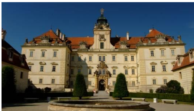
A valticei kastély

A látogatást követően autóbusszunkkal a 7 kilométerre fekvő Valticébe utaztunk. Ez a község a Liechtensteinek téli lakhelye volt (a nyári Lednicében volt). A szemképráztatóan pompás barokk berendezés, a márványborítások, a dús aranyozás, a rengeteg csillár és tükör, a festmények sokasága mind a hercegi család kivételes gazdagságáról tanúskodik.