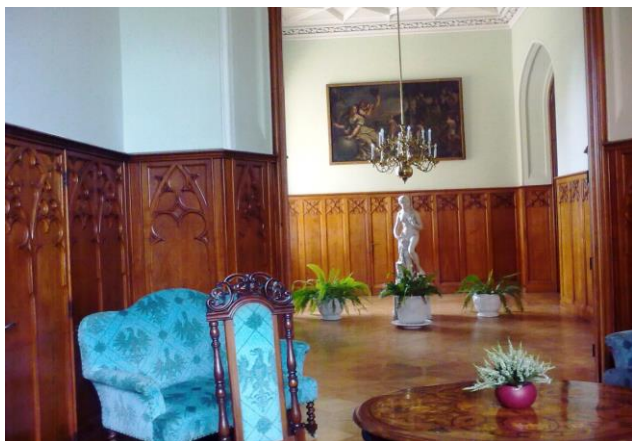
A lednicei kastélyban

A látogatást követően autóbusszunkkal a 7 kilométerre fekvő Valticébe utaztunk. Ez a község a Liechtensteinek téli lakhelye volt (a nyári Lednicében volt). A szemképráztatóan pompás barokk berendezés, a márványborítások, a dús aranyozás, a rengeteg csillár és tükör, a festmények sokasága mind a hercegi család kivételes gazdagságáról tanúskodik.