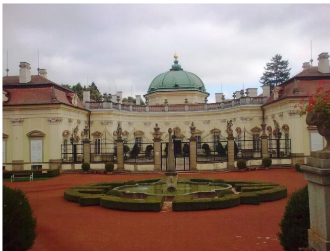
A buchlovicei kastély

Utunk következő állomása a buchlovi vár volt. Az ódon várfalak, a kivételesen mély várárok, a szép ívű és épen maradt bástyák a középkor levegőjét árasztják. A sziklafalakból növények, sőt fák nőttek ki. A hangulatos várudvar azonban az utószezon levegőjét árasztotta, már nem fogadtak látogatókat, a várban lévő kiállítás sem volt megtekinthető. A borongós időben aztán visszazárltunk az autóbuszba, és elindultunk a Brünn közelében fekvő Austerlitzba (Slavkov u Brna). Pár kilométerre a várostól zajlott az ún. három császár csatája 1805. december 2-án, amikor is Napóleon vereséget mért az egyesített osztrák-morva-orosz seregekre. Křenovice, majd Prace községeken áthaladva busszal felmentünk az austerlitz csatatér fölött magasodó óriási emlékműhöz.