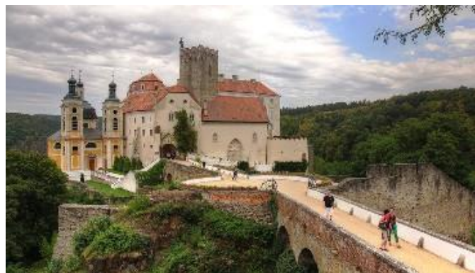
A vranovi várkastély

A városka a Thaya (morvául Diye) folyó kanyarulatában fekszik. A folyó vize itt sekély, mert a város fölött duzzasztógát és üdülőövezet található. A város fölött gőgösen uralkodik a mintegy 50 méter magas, függőleges sziklafal tetejére épített szép barokk várkastély. A város és a várkastély együttes lát képe egyszerűen lélegzetelállítóan szép. És a kastély belseje! Tele van kincsekkel: gyönyörű festményekkel, pompás bútorokkal, dísz tárgyakkal. A művészetpártoló és nagyon gazdag régi tulajdonosok hatalmas értéket halmoztak fel itt is, és a történelmi viharok dacára nagy részük ma is megcsodálható. Köszönhető ez persze az új tulajdonosnak – a cseh államnak - is, hiszen a felújítás, a gondozás szintén nagyon komoly anyagi áldozatot kíván.