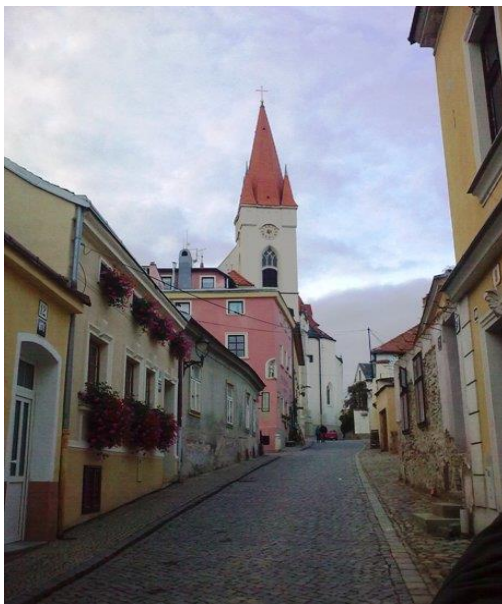
Znojmoi utcarészlet a Szent Miklós templommal

Vranovtól közvetlenül nem tudtunk átmenni Ausztriába, Hardeggbe, ezért csoportunk úgy döntött, hogy Znojmo érintésével Retz városába utazunk, ami 32 kilométer távolságra volt. Retzben vidám hangulat fogadott bennünket, a főtéren ugyanis borkóstoló volt. Nem régen fejeződhetett be a környéken a szüret, már forrt a must, így a murcit is megkóstolhattuk. Megtekintettük a műemlék házakat, a hatalmas tornyú városházát, és vásároltunk palackos bort is. Retzből délután 5 órakor érkeztünk vissza Znojmóba, ahol rövid pihenést követően egyénileg folytattuk a nappali városnézést.